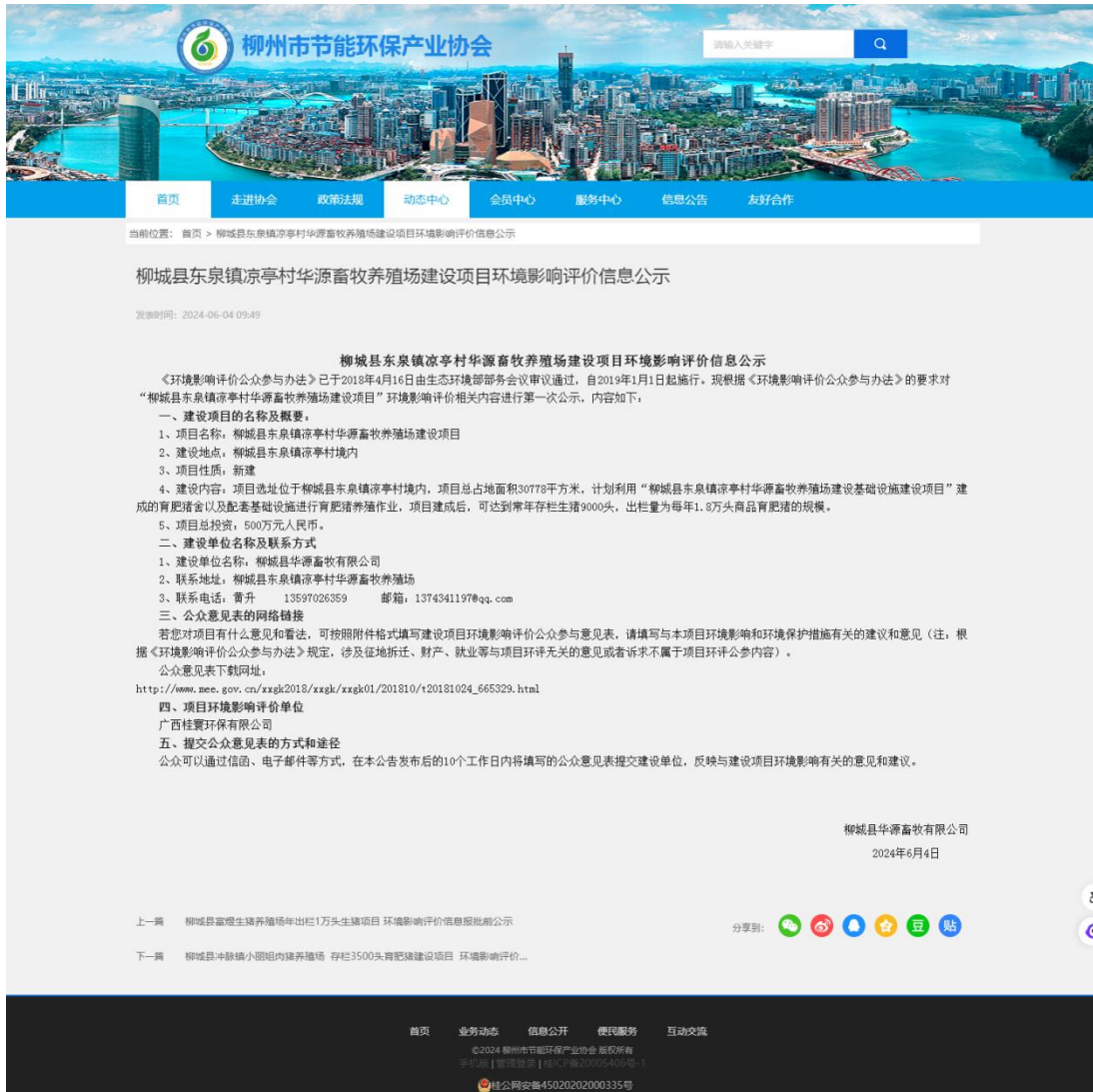
图 2-1 项目环境影响评价信息第一次公示网络截图