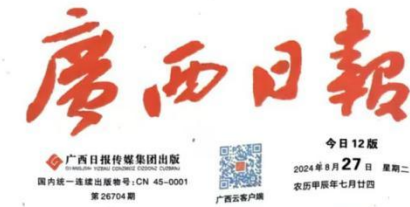
图3-2 2024年8月27日登报公示