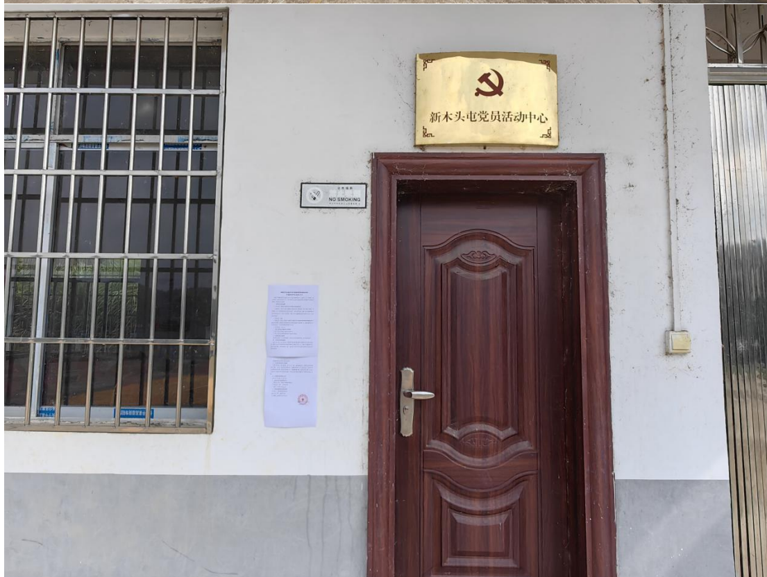
图3-5 新木头屯公共服务中心张贴项目第二次公示照片