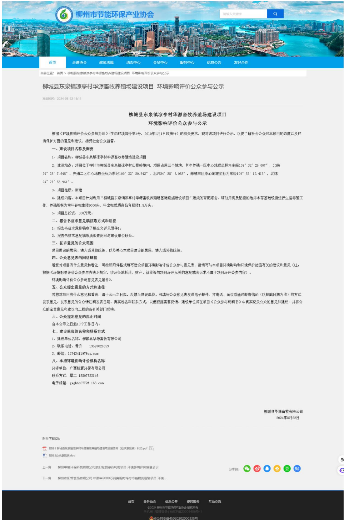
图3-1 项目环境影响评价信息第二次公示网络截图