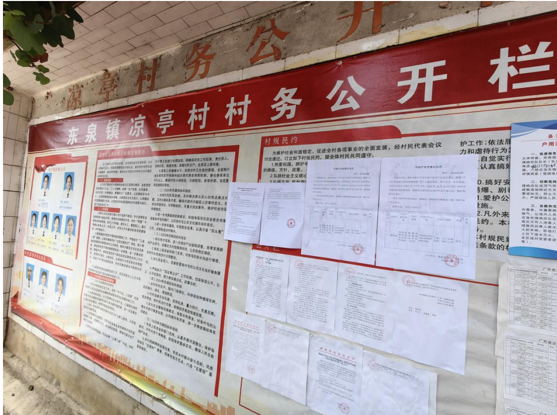
图3-4 凉亭村公告栏张贴项目第二次公示照片

建设单位于分别在项目所在地的村委以及现场周边的公众易于知悉的场所，以张贴布告的形式发布信息公告，现场张贴照片见下图。