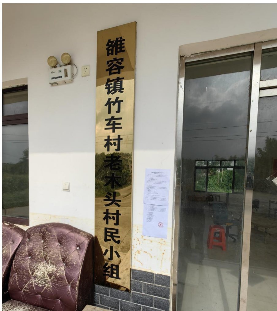
图3-5 老木头屯村民办公室门口张贴项目第二次公示照片